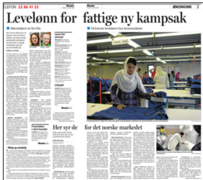
Skjermdump fra Aftenposten 17.02.2009