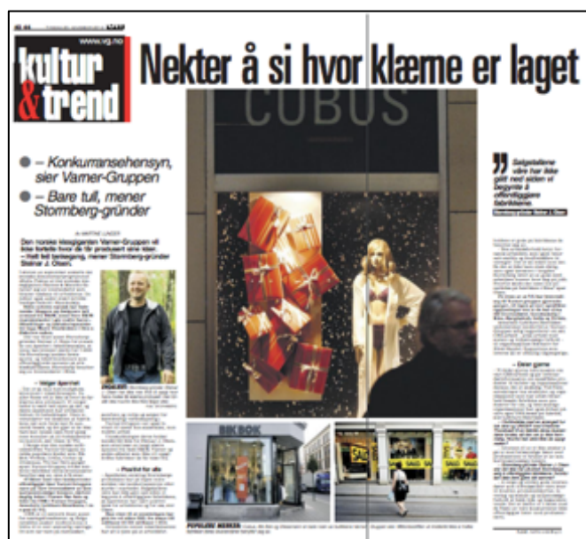
Skjermdump fra VG 20. november 2012.