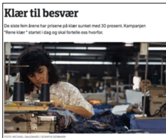
Skjermdump fra nrk.no 14.06.2007

Fri Fagbevegelse (LO-media) 16. juni 2007