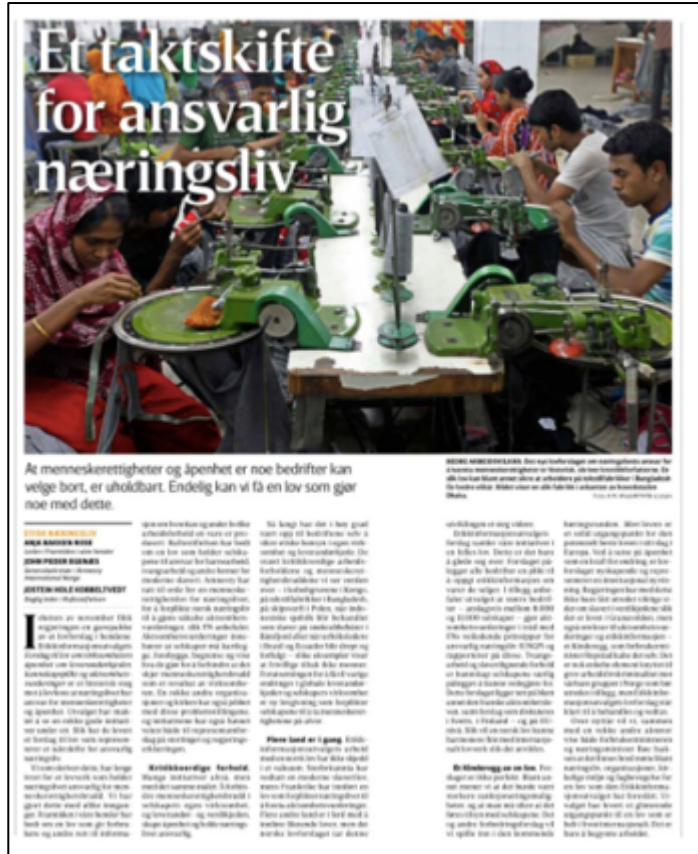
Skjermdump fra Vårt Land 20. desember 2019.

I sin resultatrapport til Norad for perioden 2017-2019 påpekte FIVH at «lovforslaget må fortsatt vedtas av Stortinget», men konstaterte også at «vi har kommet langt etter årelangt og målbevisste arbeid for å informere om utfordringer i leverandørkjedene, og behovet for åpenhet og ansvarliggjøring av selskapene» (for ytterligere informasjon, se Del 2, bærekraftsmål 12).