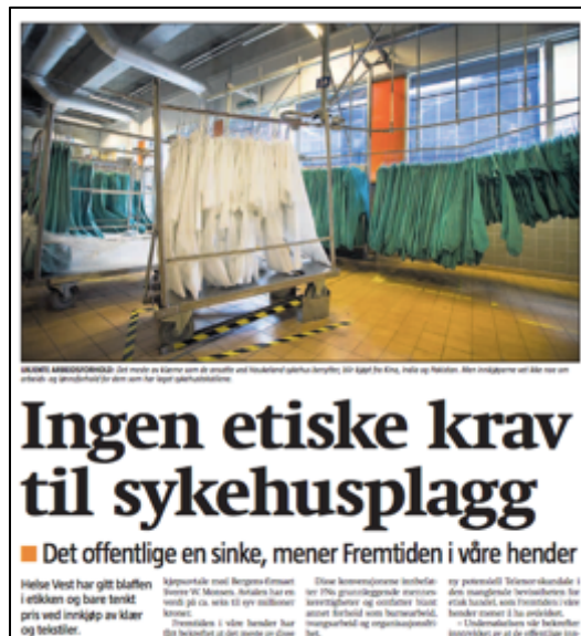
Skjermdump fra Bergens Tidende 12.07.2008

«I mange land hvor klær for det norske markedet produseres, er minstelønnen svært lav og dekker sjelden de grunnleggende behov hos arbeiderne. Det betyr at disse ofte må arbeide svært lange pass og mange dager i strekk for å i det hele tatt kunne klare seg. Selv den reelle lønnen (dvs. den lønn arbeiderne får utbetalt) ligger på omtrent halvparten av det som kan anses som en levelønn i land som Kina, Bangladesh, Thailand og India. En levelønn er derimot en lønn som dekker de grunnleggende behov en familie har slik som mat, rent vann, husrom, klær, utdanning for barna, grunnleggende helsestell og litt ekstra til sparing eller uforutsette utgifter.»