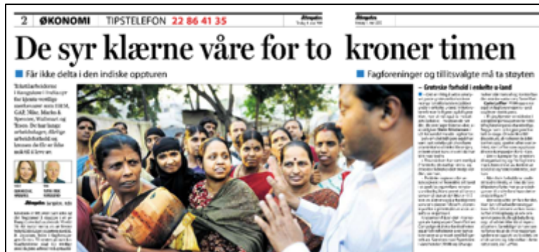
Skjermdump fra Aftenposten 4. mai 2010

«Resultat på outcome-nivå er at en klesaktør i Norge har gått over til å inkludere «levelønn» i sine etiske retningslinjer etter at vi rettet søkelyset mot temaet. I tillegg vet vi at et annet selskap vurderer å gjøre det samme. Vi vet imidlertid at det å gå til angrep på kjedenes lønnsomhet og vilje til å betale mer for varene er «tung» materie som har møtt mye motstand fra ulike aktører, først og fremst fra kleskjedene selv.»