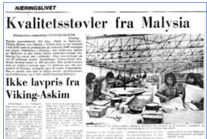
Faksimile fra Aftenposten 20. mars 1976

«Fra bedriftsledelsens side blir det fremholdt at bakgrunnen for utflyttingen var den vanskelige arbeidskraft-situasjonen i Askim i begynnelsen av 1970-årene, og det faktum at omkostningsnivået i Norge gjorde produksjonen tapsbringende. Da gummistøvelproduksjon er meget arbeidsintensiv og for en stor del består av håndarbeide, var den billigere arbeidskraft i Malaysia en vesentlig faktor. Arbeidslønninger på mellom 500 og 1500 kroner måneden kan synes urimelig lave etter norsk målestokk, men er på den annen side blant de høyeste som betales i malayisk industri. Særlig blir den kvinnelige arbeidskraft betalt betydelig over gjennomsnittet.