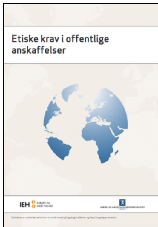
En veileder for etiske krav i offentlige anskaffelser ble utarbeidet av Initiativ for Etisk Handel (IEH) på oppdrag fra Barne- og familiedepartementet i 2009.