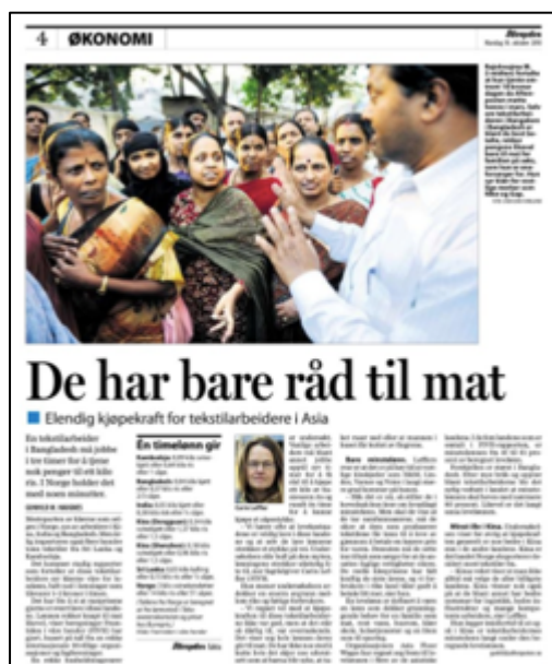
Skjermdump fra Aftenposten 18. oktober 2010.

Eksempel på kjøpekraft for tekstilarbeider, hentet fra rapporten «Mye arbeid, små marginer» 2010