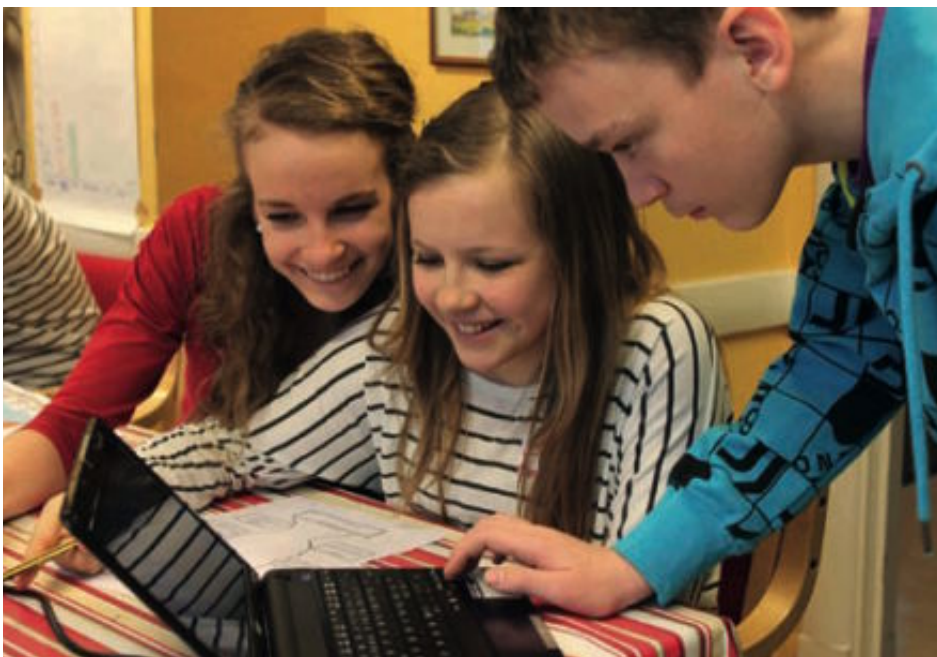
TOM VERKTØYKASSE: Der lærebøkene på 1970- og 1980-tallet beskrev hvordan nasjonalstatene kunne gjøre noe med skjevfordelingen i verden, som å gi bistand eller støtte FN, skriver man i dag at globaliseringen har gjort at vi ikke lenger har de verktøyene, mener forfatterne av rapporten «Nord/Sør-perspektivet i norske lærebøker».