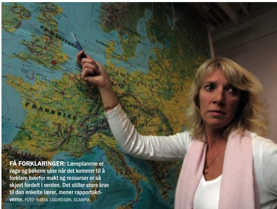
FÅ FORKLARINGER: Læreplanene er vage og bøkene ulne når det kommer til å forklare hvorfor makt og ressurser er så skjevt fordelt i verden. Det stiller store krav til den enkelte lærer, mener rapportskriverne.